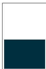
1/2 Seite quer S: 184 x 132 mm