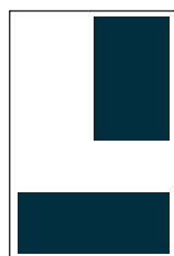
1/4 Seite hoch S: 90 x 132 mm 1/4 Seite quer S: 184 x 64 mm