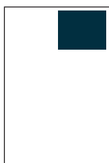
1/8 Seite S: 90 x 64 mm